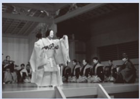
シテ：八世観世鏡之丞